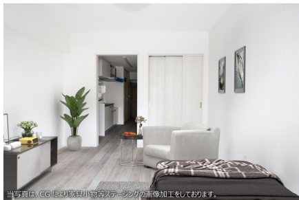
当写真は、CGIにより家具・カーテン等の画像加工をしております。