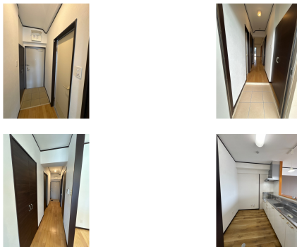
※別の部屋（反転タイプ）の写真を使用しています。